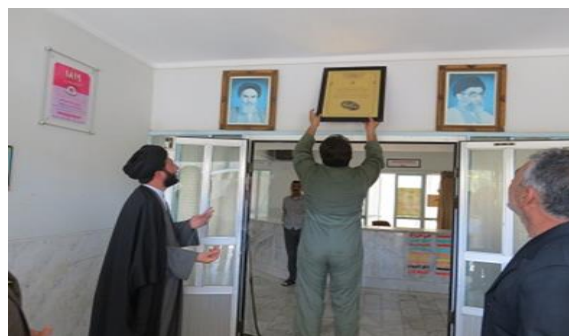
تصویر شماره‌ی ۳- مراسم نصب لوح شافی در بیمارستان

تصویر شماره‌ی ۴- متن تعهدآور نصب‌شده در معرض دید